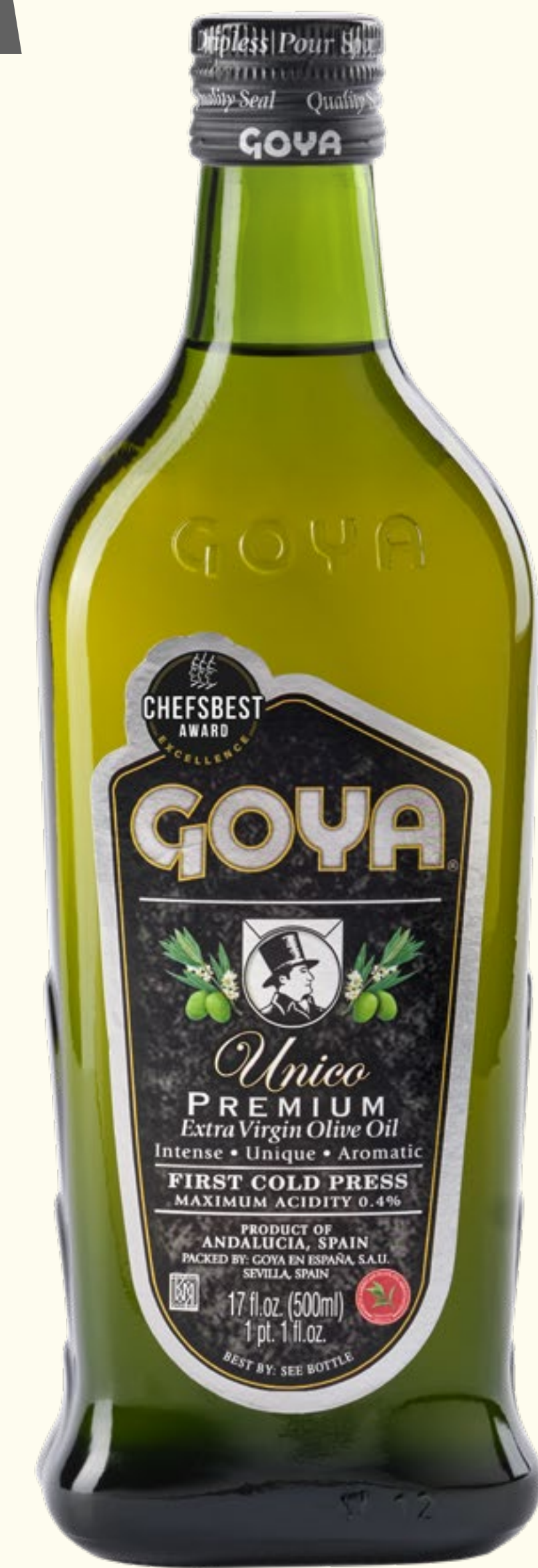
Aceite de Oliva Virgen Extra Premium Unico