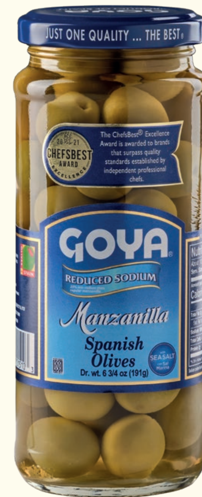
Aceitunas verdes Manzanilla enteras

Línea de productos específicos con los que ofrecemos a nuestros consumidores alternativas con menor contenido en sodio, manteniendo nuestro incomparable sabor y calidad.