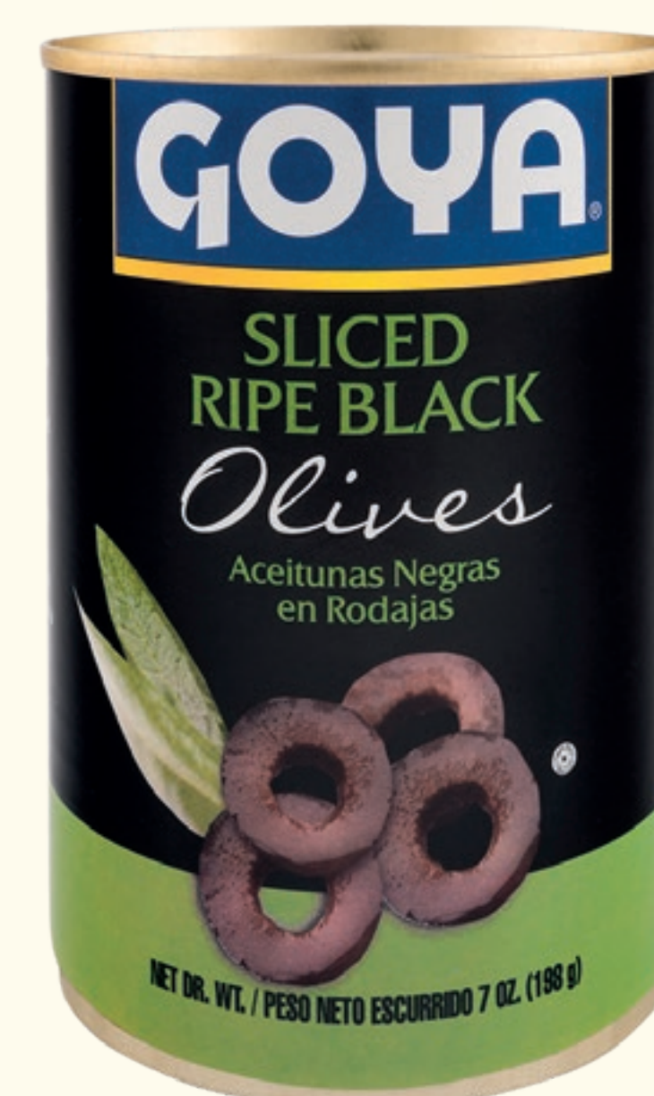
Aceitunas Negras en Rodajas