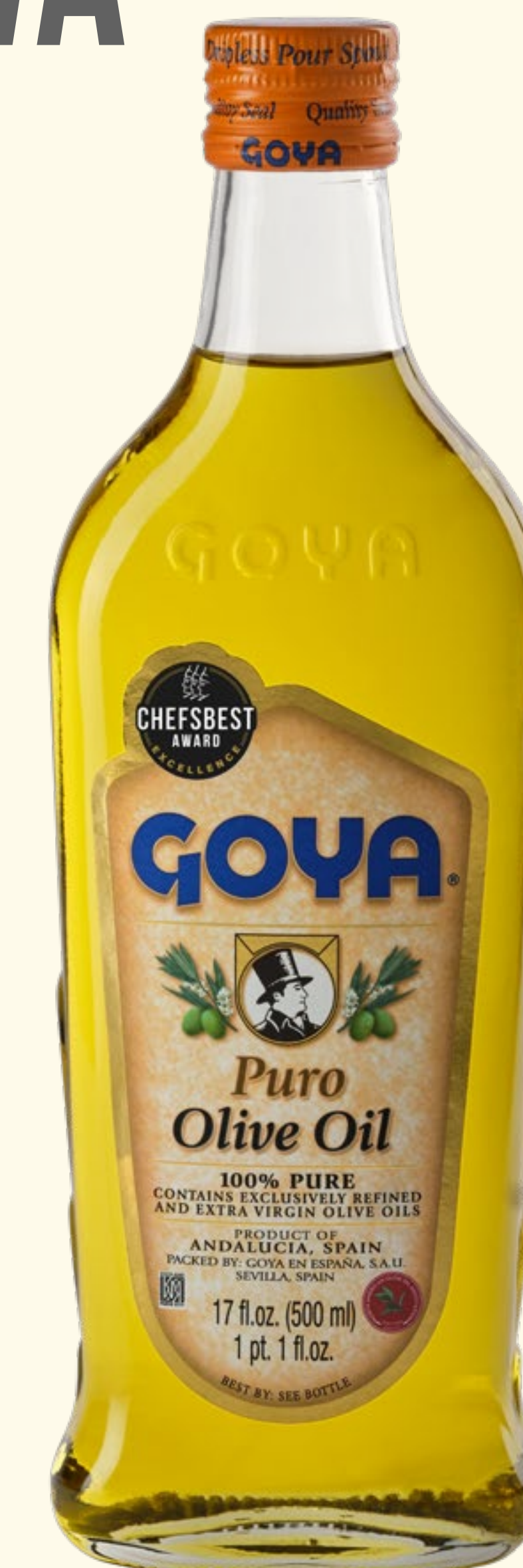
Aceite de Oliva Puro