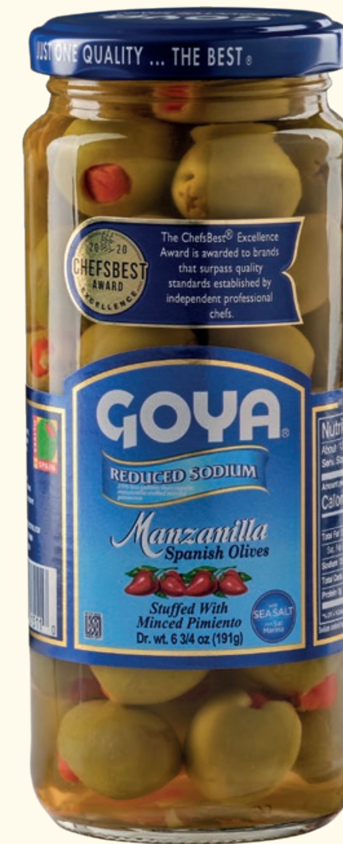
Aceitunas verdes Manzanilla rellenas con Pimiento picado