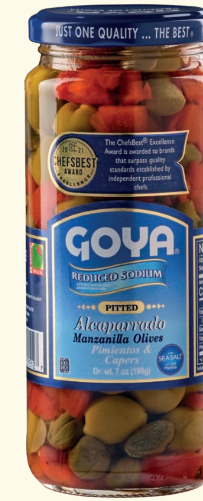
Alcaparrado deshuesado Aceitunas Manzanilla deshuesadas, Pimientos y Alcaparras