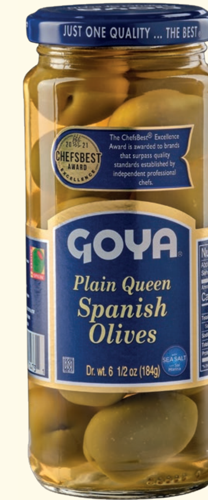
Aceitunas Gordales verdes enteras