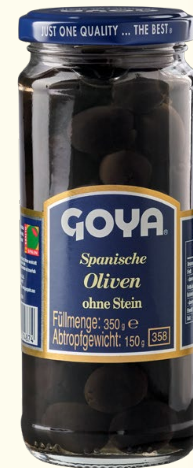
Aceitunas Negras Enteras

Seguimos para su elaboración el denominado “Estilo Californiano”, para obtener una aceituna negra con una tonalidad más suave en su interior, más intensa y oscura en su aspecto externo y completamente homogénea.