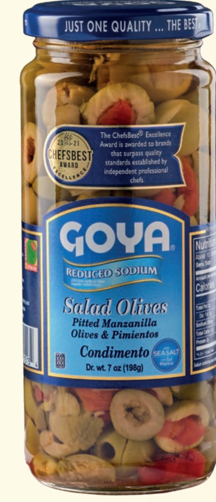
Salad Olives Aceitunas Manzanilla deshuesadas y Pimientos. Condimento