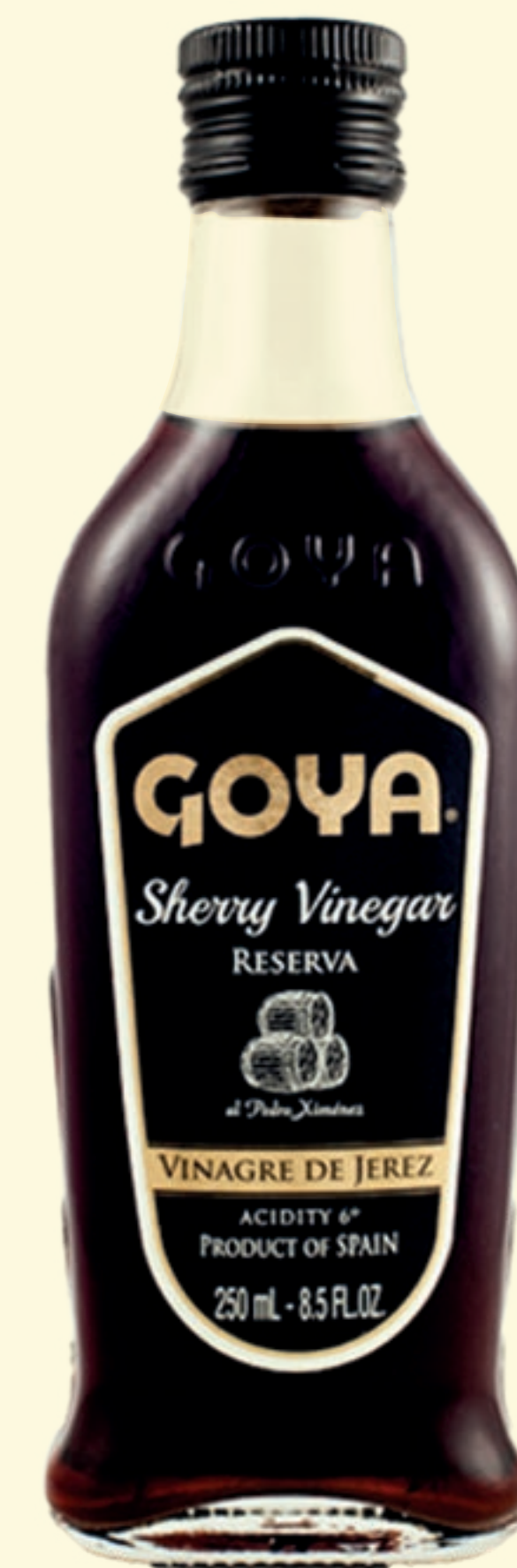
Vinagre de Jerez Reserva al Pedro Ximénez

El aderezo ideal en platos y postres trae a la mesa la esencia de los vinos del marco de la Denominación de Origen de Jerez. También disponible el vinagre balsámico.