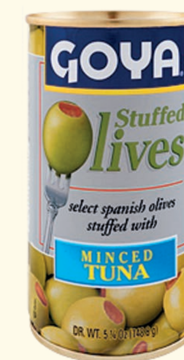
Aceitunas Rellenas de Atún picado