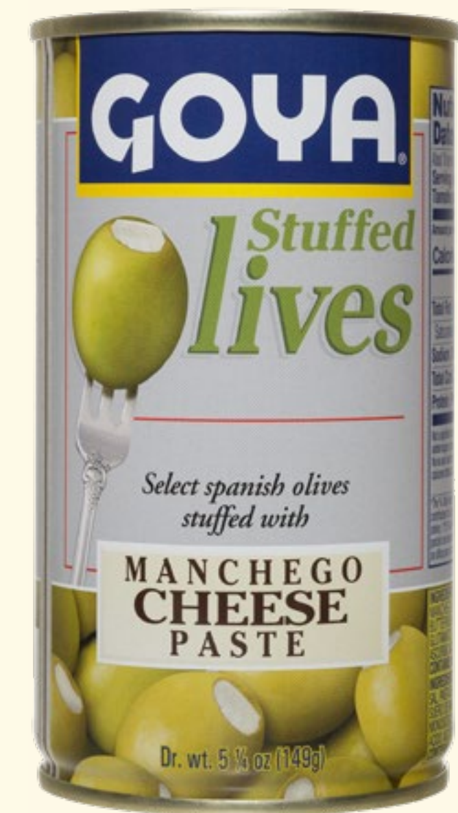
Aceitunas Rellenas con Queso Manchego en pasta