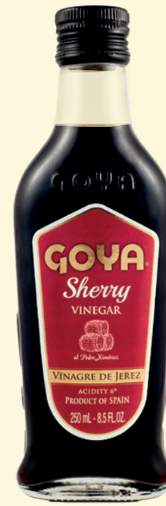
Vinagre de Jerez al Pedro Ximénez