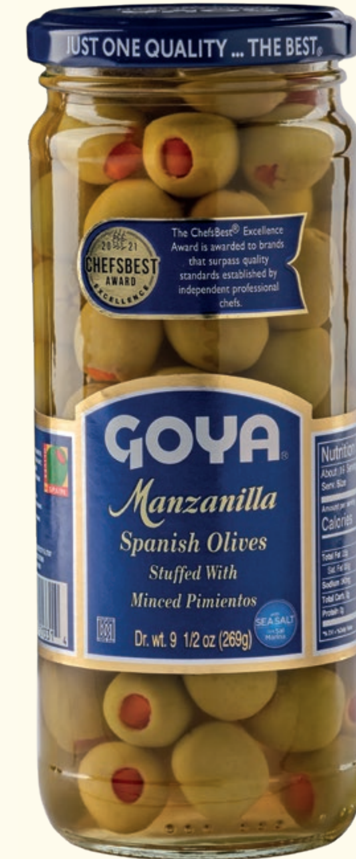
Aceitunas verdes Manzanilla rellenas con Pimientos picados