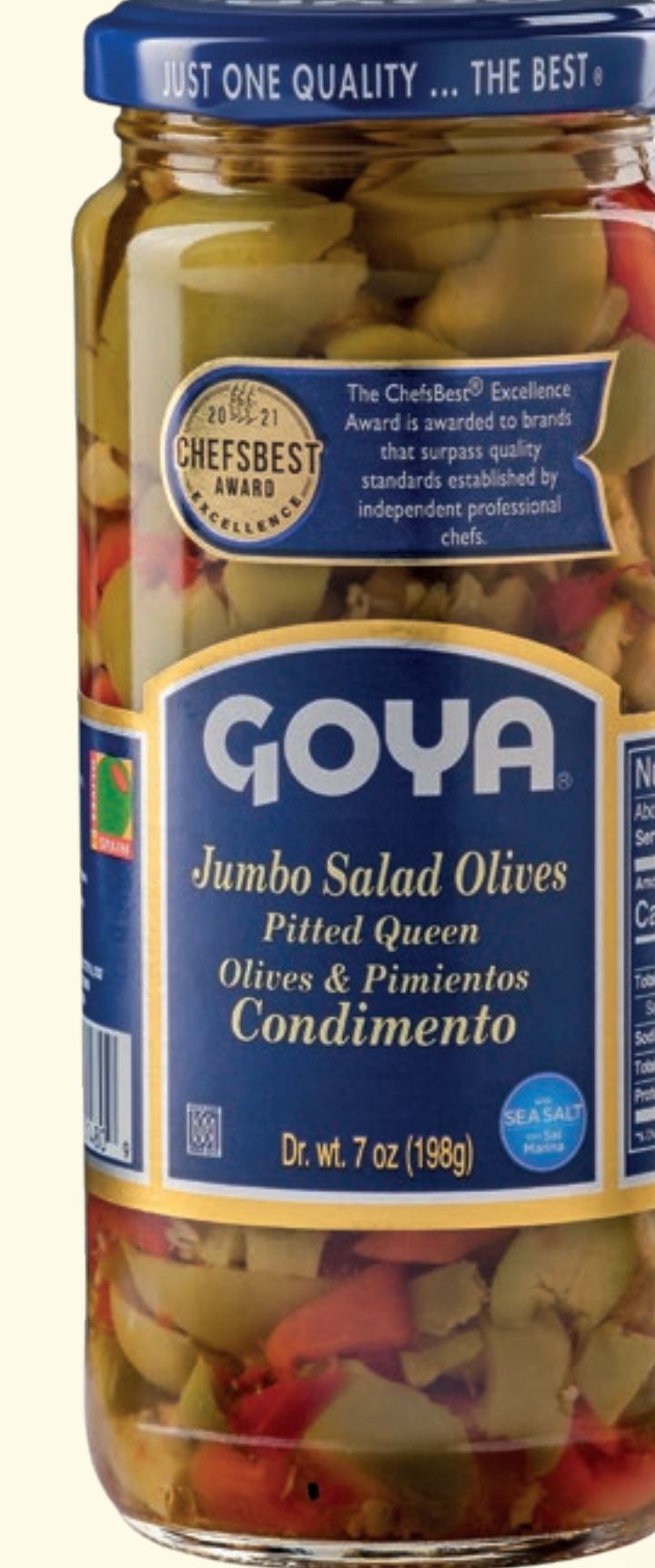
Jumbo Salad Olives Aceitunas Gordales verdes y Pimientos asados. Condimento