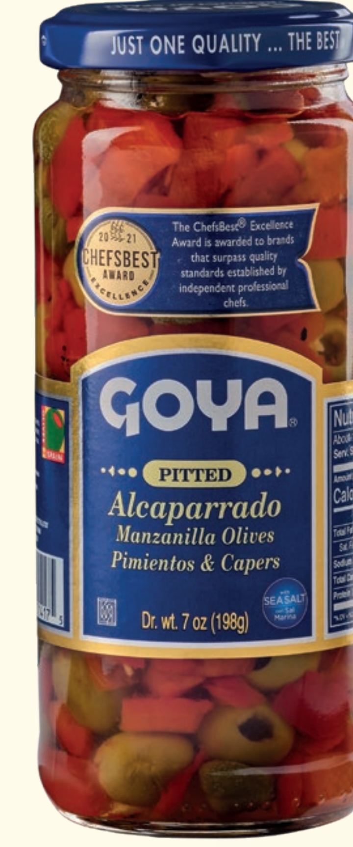
Alcaparrado deshuesado Aceitunas Manzanilla deshuesadas, Pimientos asados y Alcaparras