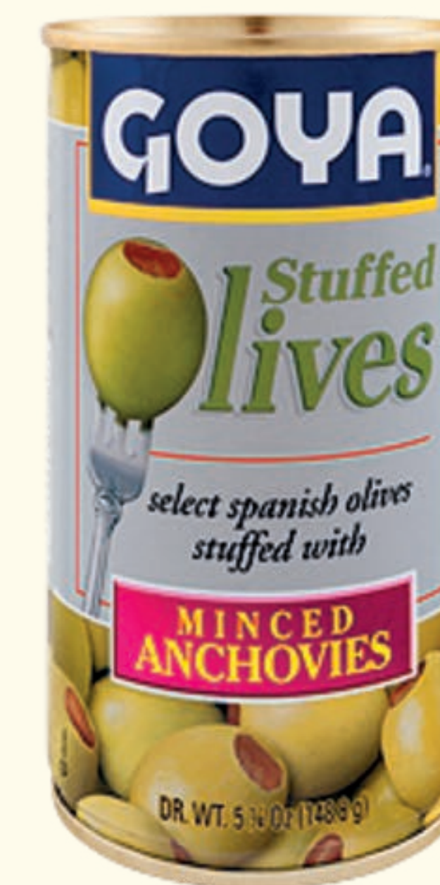
Aceitunas Rellenas con Anchoas picadas