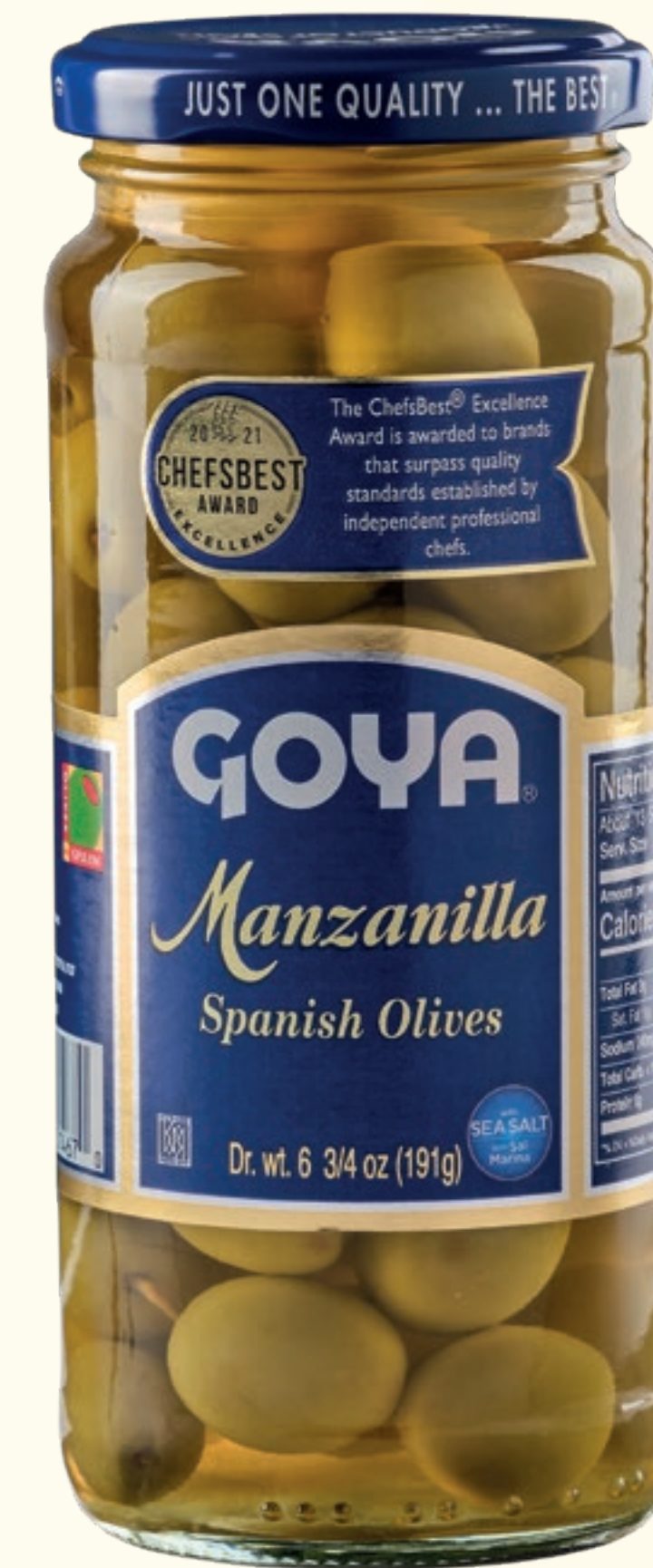
Aceitunas verdes Manzanilla enteras

Una especialidad para cada paladar que combina pureza y tradición con una amplia gama de elaboraciones.