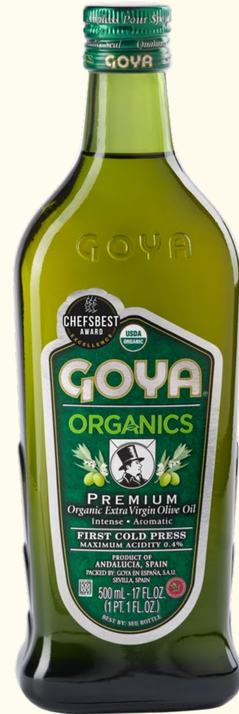
Aceite de Oliva Virgen Extra Premium Organics