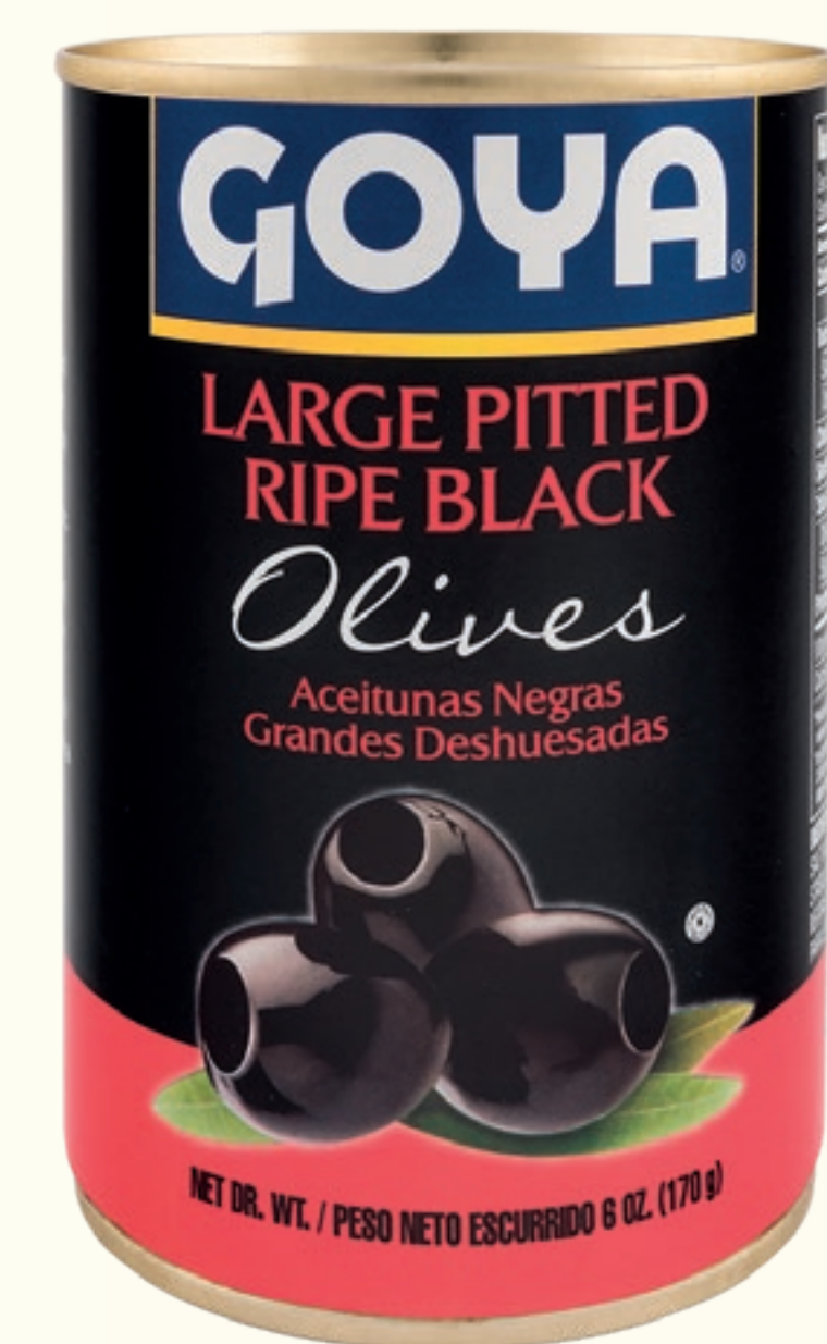
Aceitunas Negras Deshuesadas Grandes