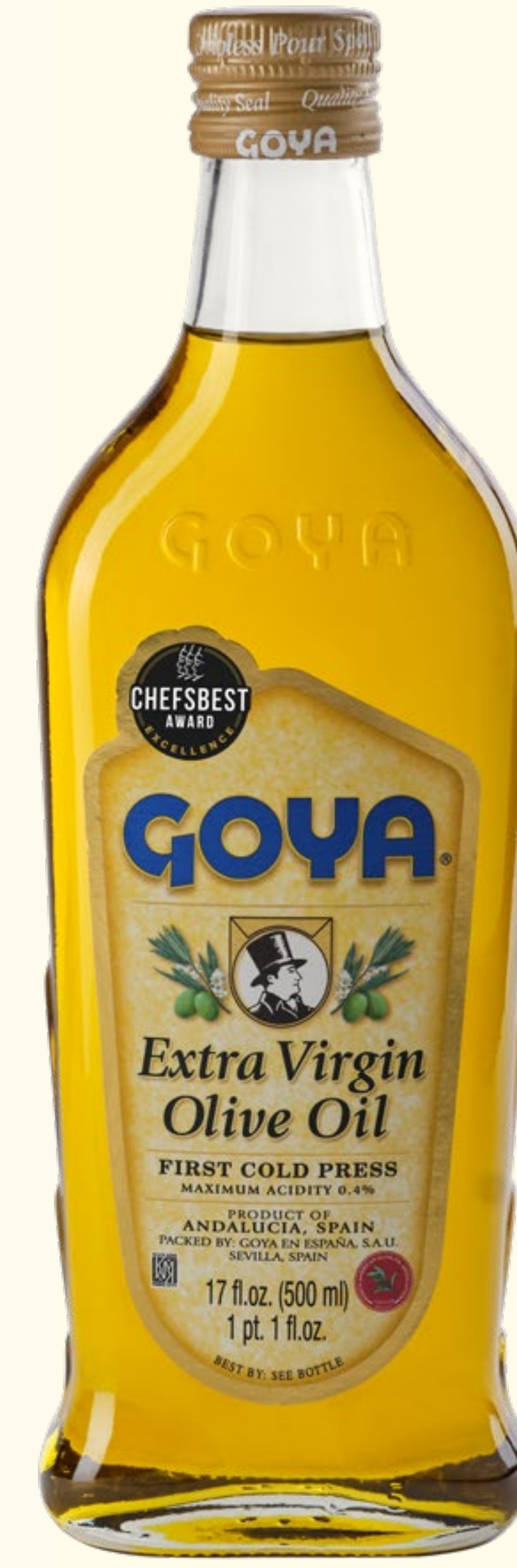
Aceite de Oliva Virgen Extra