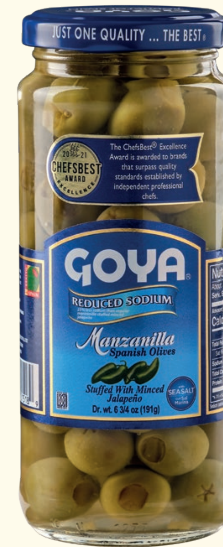
Aceitunas verdes Manzanilla rellenas con Pimiento Jalapeño picado