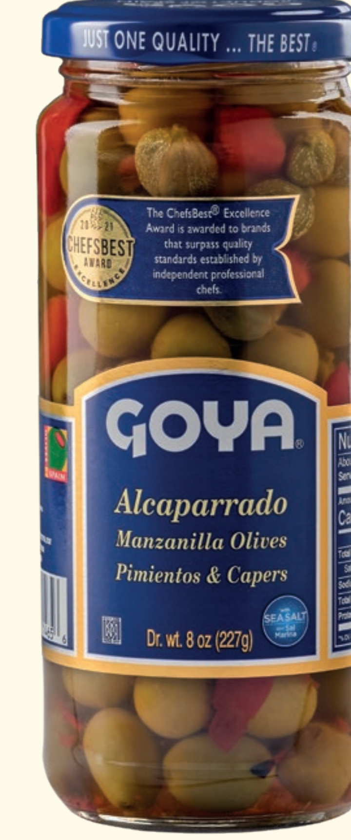
Alcaparrado Aceitunas Manzanilla enteras, Pimientos asados y Alcaparras