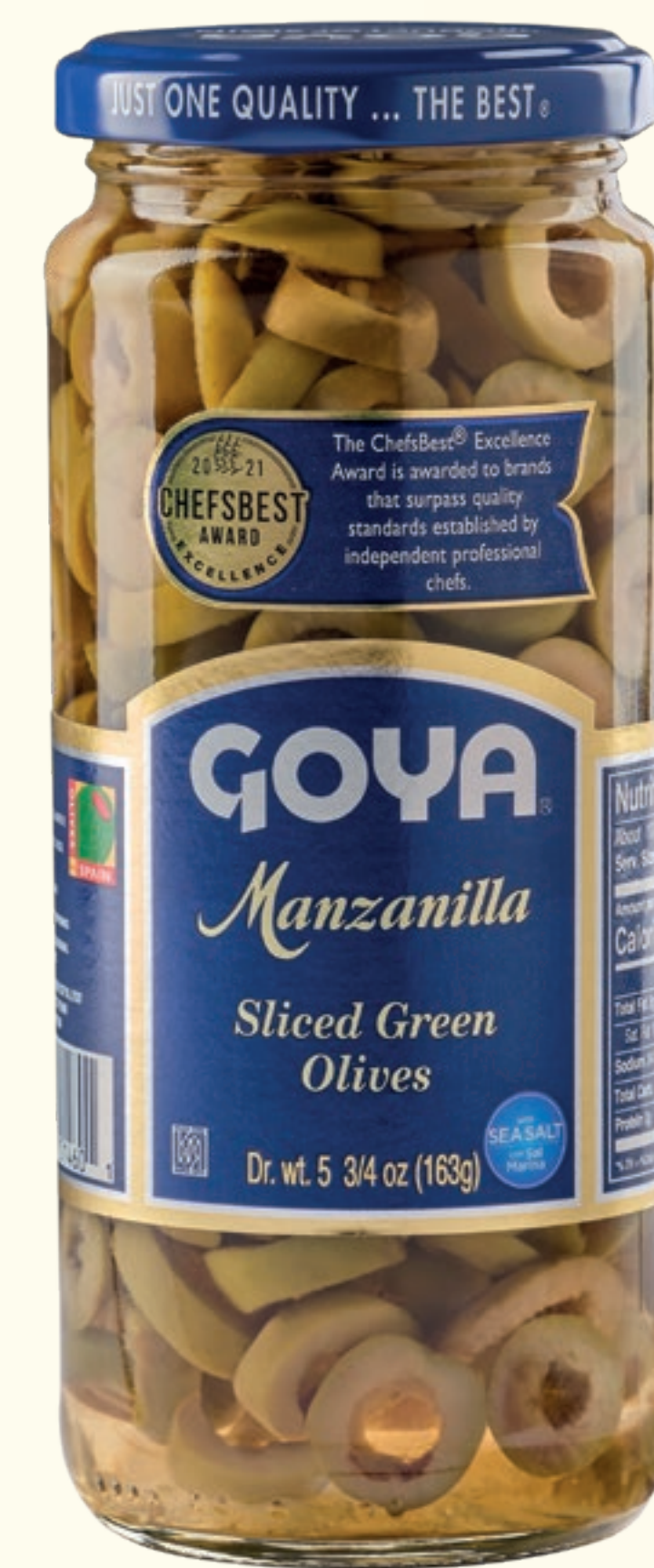
Aceitunas verdes Manzanilla en rodajas