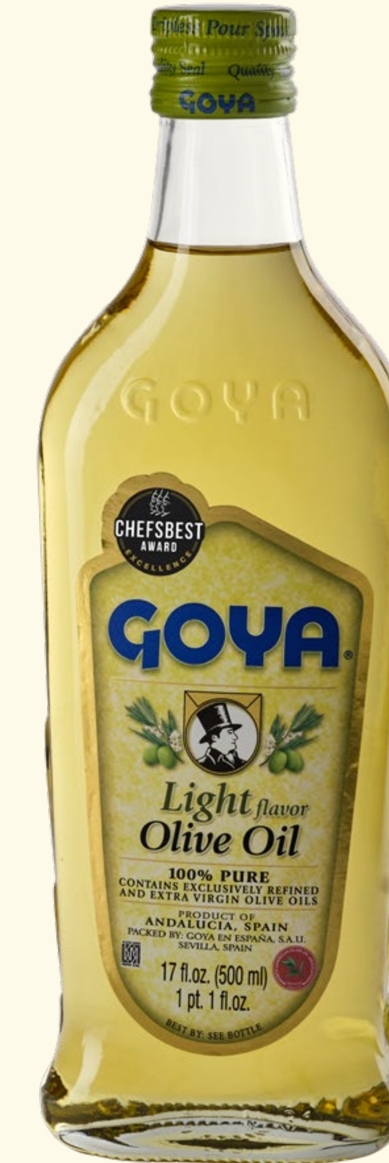
Aceite de Oliva Light Flavor