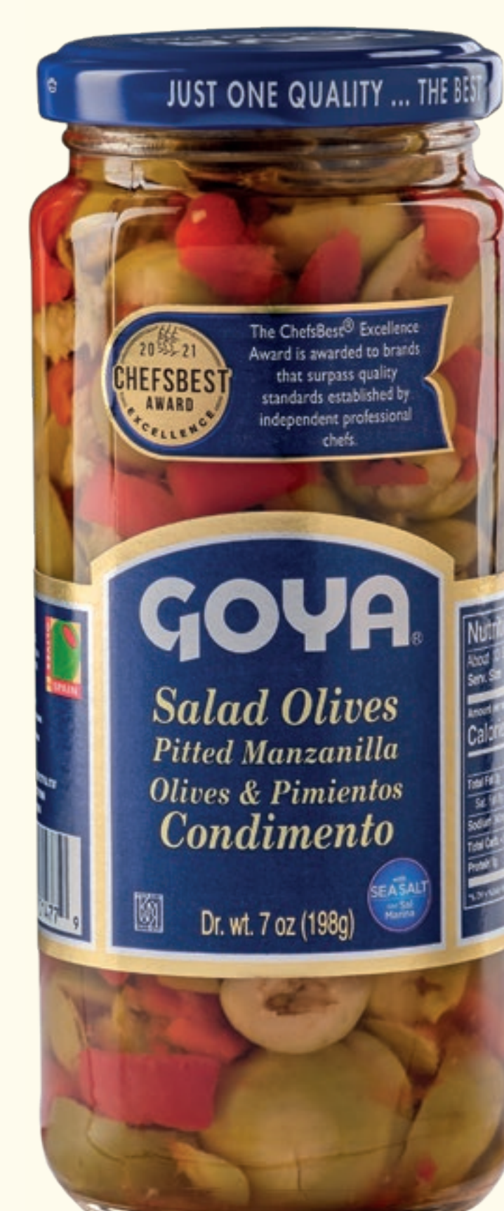
Salad Olives Aceitunas Manzanilla deshuesadas y Pimientos asados. Condimento