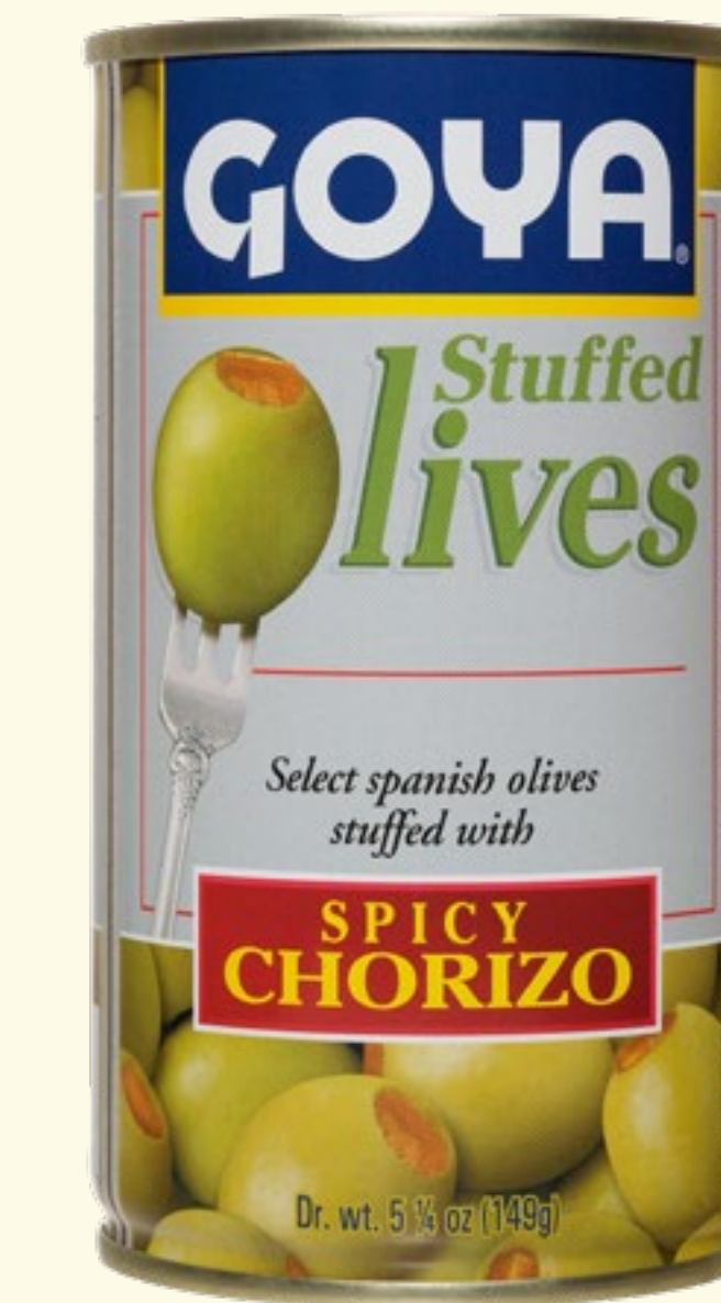
Aceitunas Rellenas con Chorizo Picante