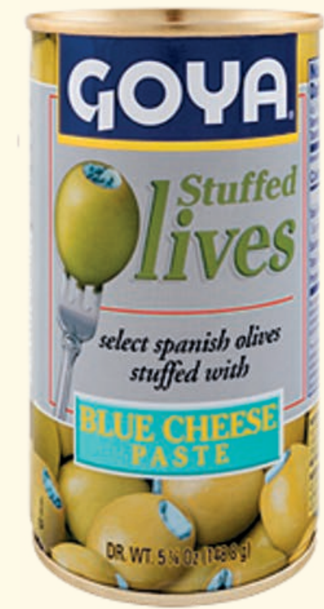
Aceitunas Rellenas de Queso azul en pasta