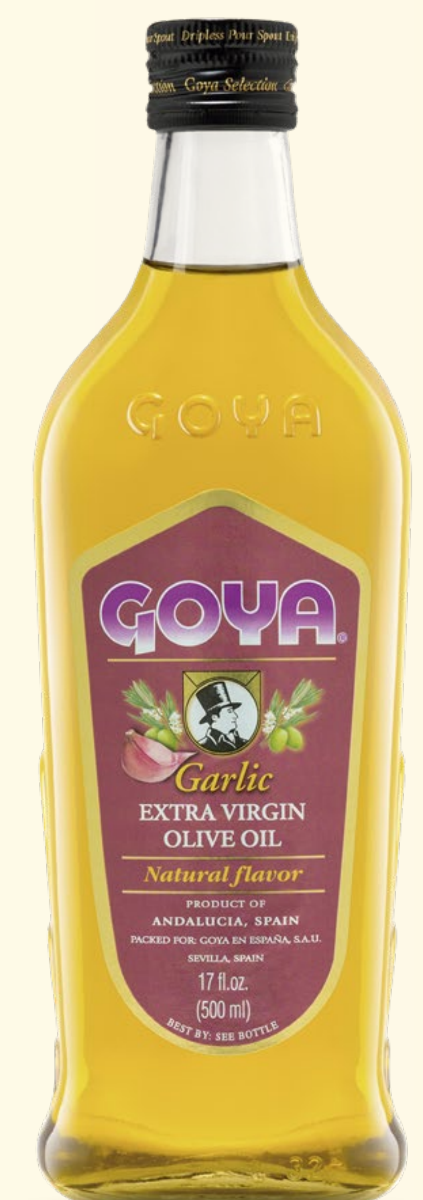
Aceite de Oliva Virgen Extra Garlic