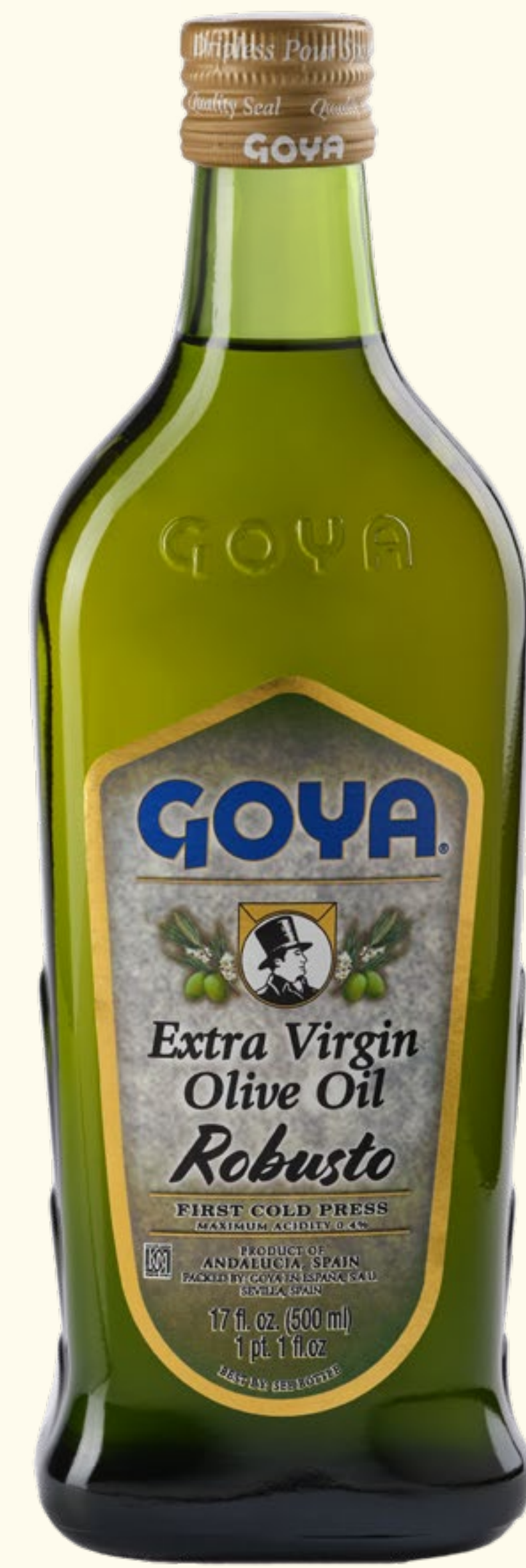
Aceite de Oliva Virgen Extra Robusto