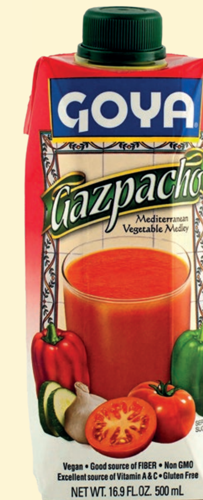
Gazpacho 500 ml

Obtenido sobre el modelo de elaboración de nuestros aceites: equilibrado. Con una vida útil de un año, nuestro Gazpacho puede competir con otros gazpachos frescos en catas ciegas.