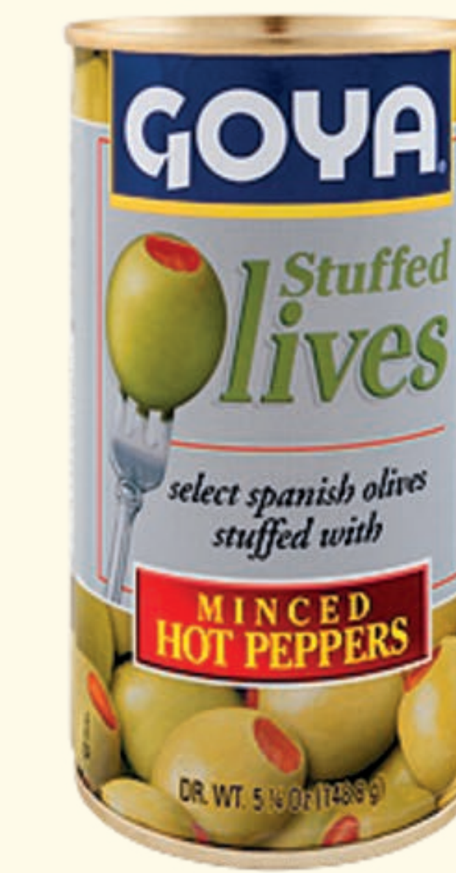
Aceitunas rellenas con Pimientos picantes picados