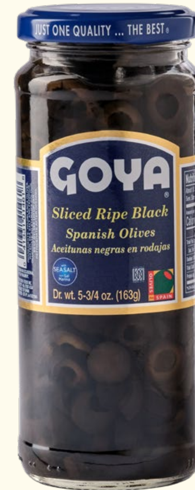
Aceitunas Negras Deshuesadas