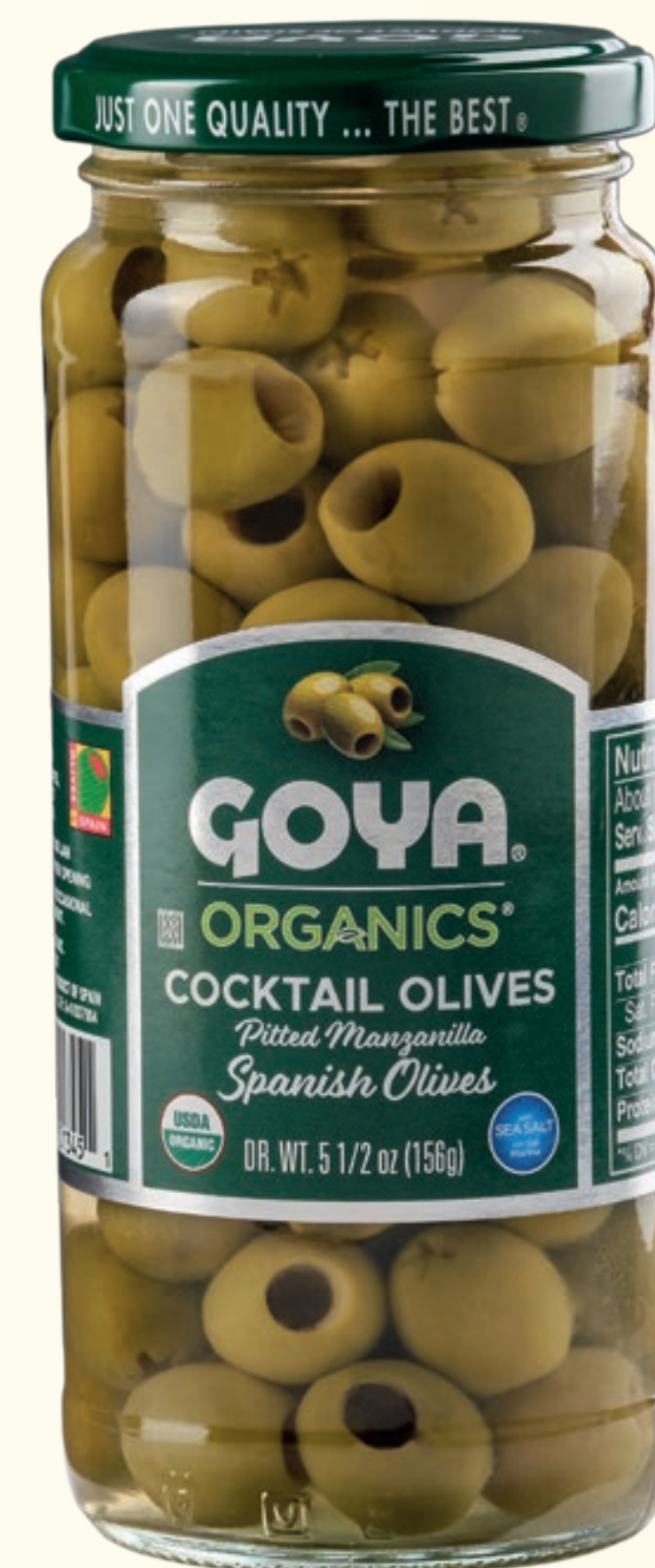
Aceitunas verdes Manzanilla deshuesadas