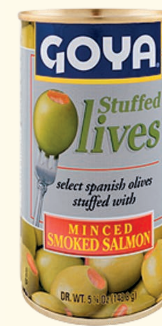
Aceitunas Rellenas con Salmón ahumado