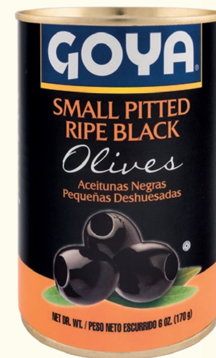
Aceitunas Negras Deshuesadas Pequeñas