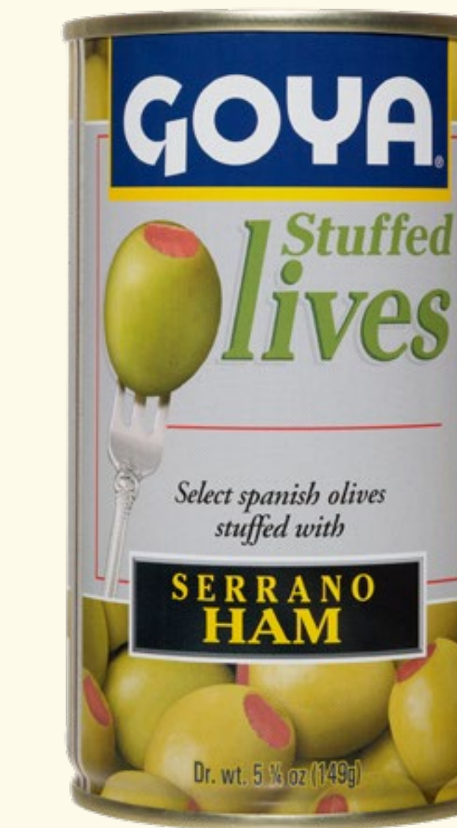
Aceitunas Rellenas de Jamón Serrano

Una amplia variedad de rellenos de calidad, con el incomparable sabor de la aceituna manzanilla.