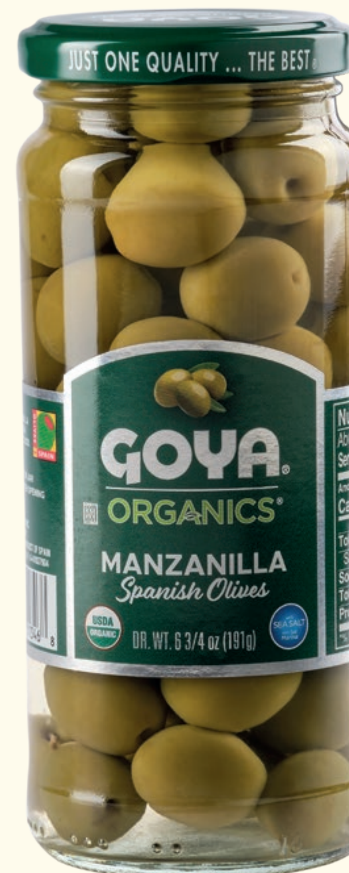
Aceitunas verdes Manzanilla enteras