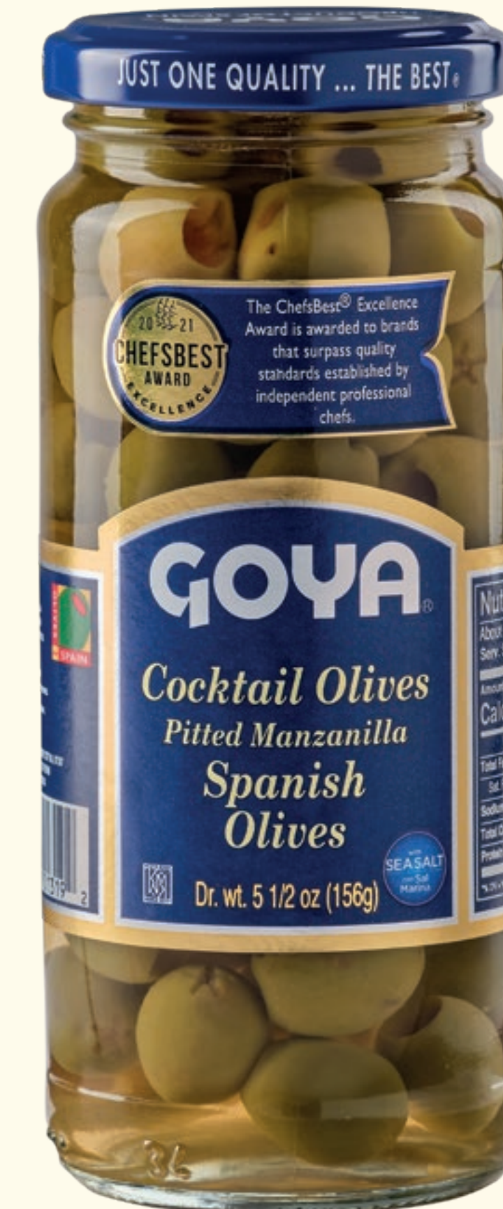
Cocktail Olives Aceitunas verdes Manzanilla deshuesadas