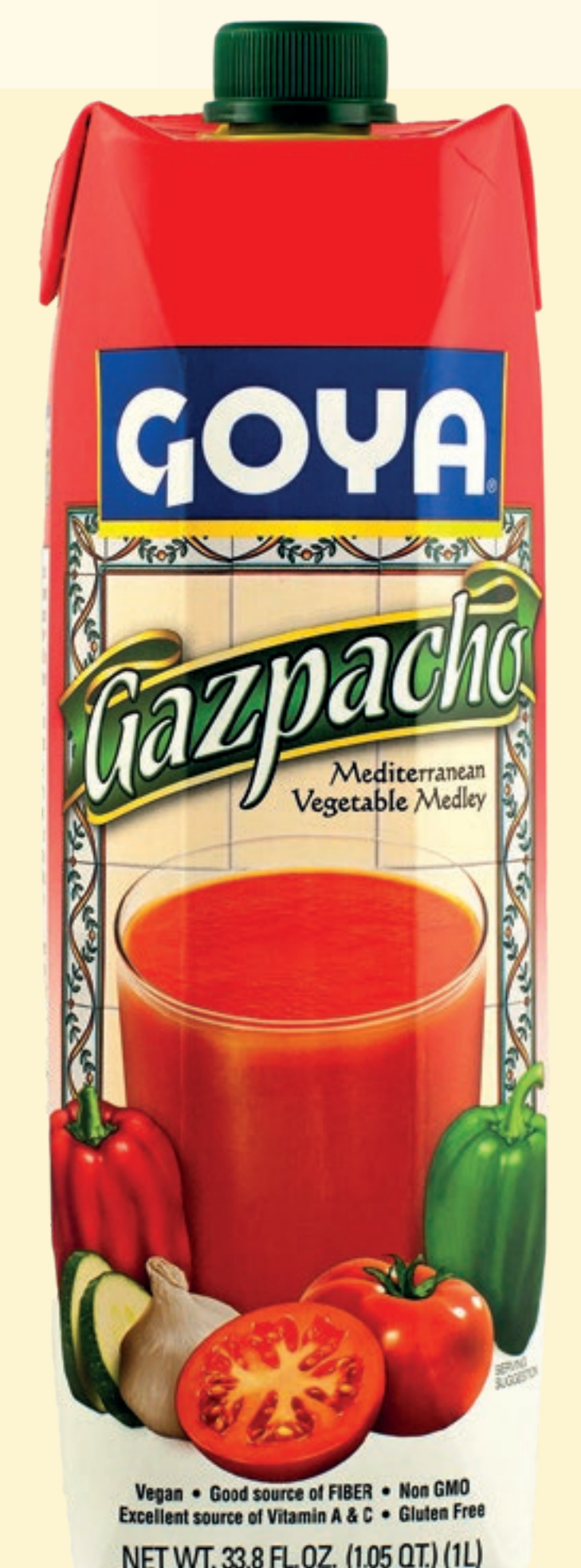
Gazpacho 1 l