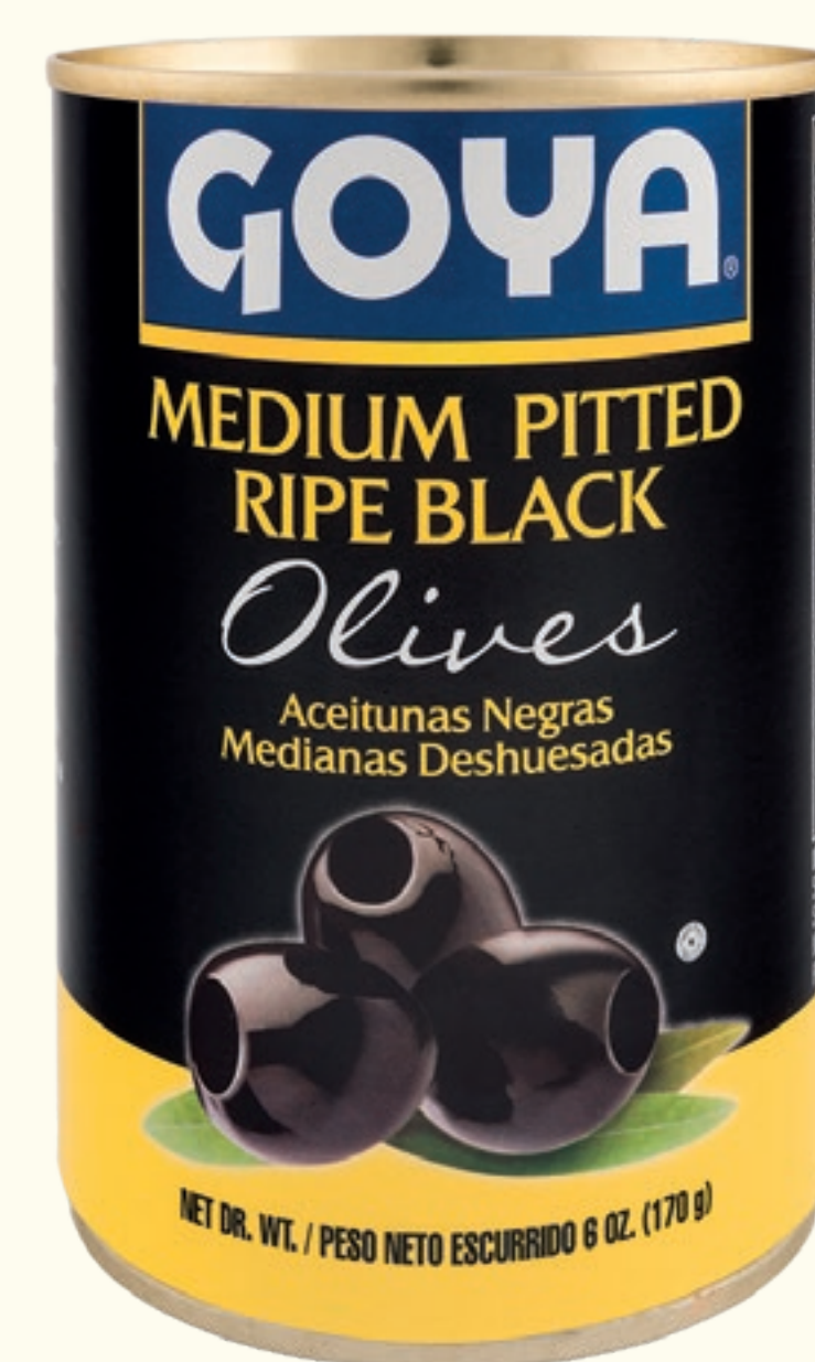
Aceitunas Negras Deshuesadas Medianas